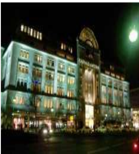
Exterior del KaDeWe