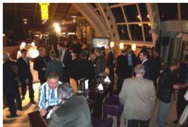
Imagen durante el evento