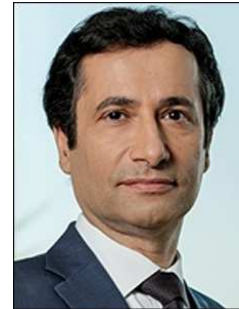
Sr. Mohamed BENCHABOUN Ministro de Economía y Finanzas