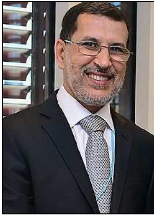
Sr. Saâd-Eddine EL OTHMANI Jefe de Gobierno