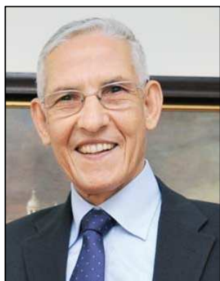
Sr. Lahcen DAOUDI

Ministro delegado ante el Jefe de Gobierno encargado de Asuntos Generales y la Gobernanza