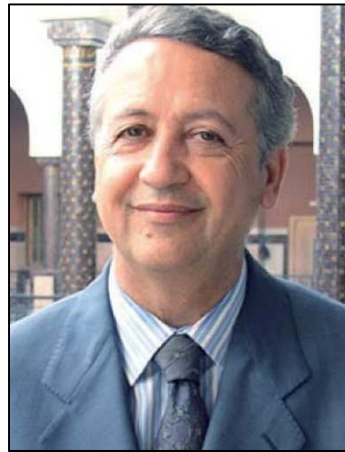
Sr. Mohamed SAJID Ministro de Turismo, Transporte Aéreo, Artesanía y Economía Social