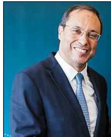
Sr. Abdelkader AMARA Ministro de Equipamiento, Transporte, Logística y Agua