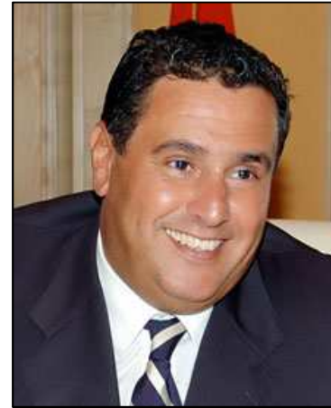
Sr. Aziz AKHANNOUCH Ministro de Agricultura y Pesca, Desarrollo Rural y Aguas y Bosques