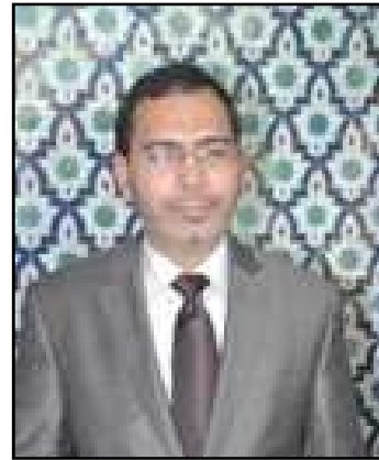
Sr. Mustapha El KHALFI Ministro delegado ante el Jefe de Gobierno, responsable de las relaciones con el Parlamento y la Sociedad Civil y Portavoz del Gobierno