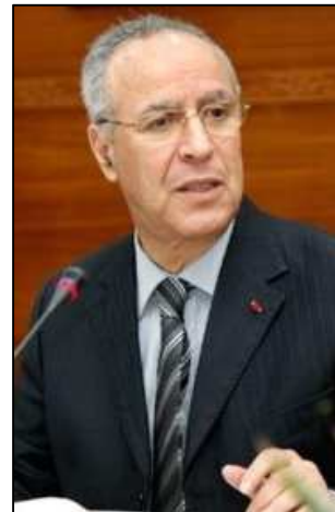
Sr. Ahmed TOUFIQ Ministro de Habuses y Asuntos Islámicos