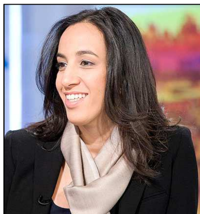
Sra. Mbarka BOUAIDA

Secretaria de Estado ante el Ministro de Industria, de Inversión, Comercio y Economía Digital, responsable de Comercio Exterior