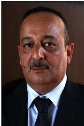
Sr. Mohamed EL AARAJ Ministro de Cultura y Comunicación