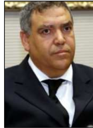
Sr. Abdelouafi LAFTIT Ministro del Interior