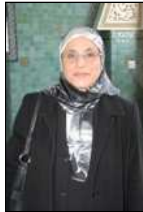
Sra. Bassima EL HAKKAOUI Ministra de Familia, Solidaridad, Igualdad y Desarrollo Social