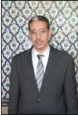
Sr. Aziz REBBAH Ministro de Energía, Minas y Desarrollo Sostenible