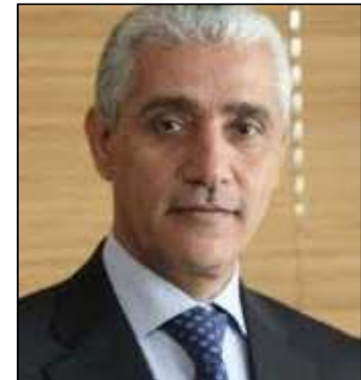
Sr. Rachid TALBI ALAMI Ministro de Juventud y Deportes