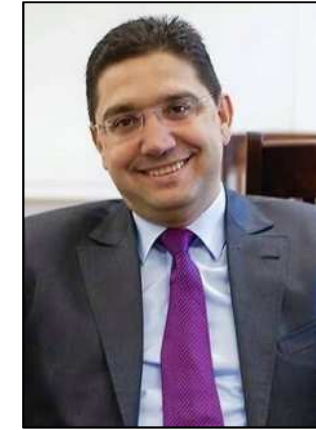
Sr. Nasser BOURITA Ministro de Asuntos Exteriores y Cooperación Internacional