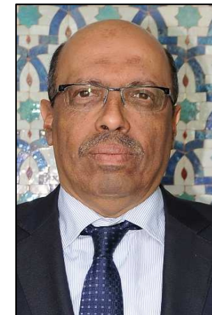
Sr. Noureddine BOUTAYEB Ministro delegado ante el Ministro de Interior