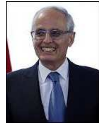
Sr. Abdelahad FASSI FIHRI Ministro de Ordenación del Territorio Nacional, Urbanismo y Vivienda y Política de la Ciudad