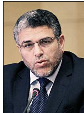
Sr. Mustapha RAMID Ministro de Estado encargado de los Derechos Humanos