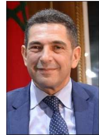
Sr. Saïd AMZAZI Ministro de Educación Nacional, Formación Profesional, Enseñanza Superior e Investigación Científica