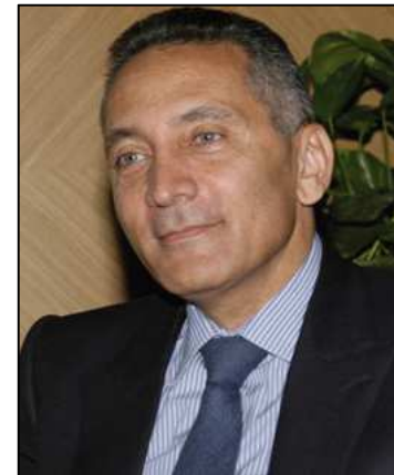
Sr. Moulay Hafid ELALAMY Ministro de Industria, Inversión, Comercio y Economía Digital