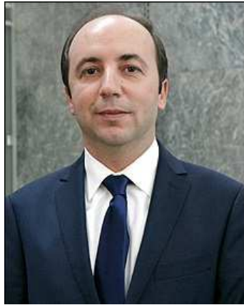
Sr. Anas DOUKKALI Ministro de Sanidad