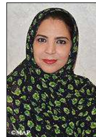
Sra. Rkia DERHAM

Ministro delegado ante el Ministro de Asuntos Exteriores y Cooperación Internacional, responsable de la Cooperación Africana